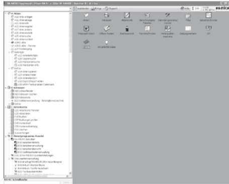
Abbildung 1: RA-Micro Oberfläche

Adressenprogramm auch ein Modul „eAkte“ zum Speichern und effizienten Aufrufen der Schriftsätze, Dateien und sonstigen Schreiben zur jeweiligen Akte vorhanden ist. Zudem gibt es Aktenkonten, Tabellen, Finanzbuchhaltung,